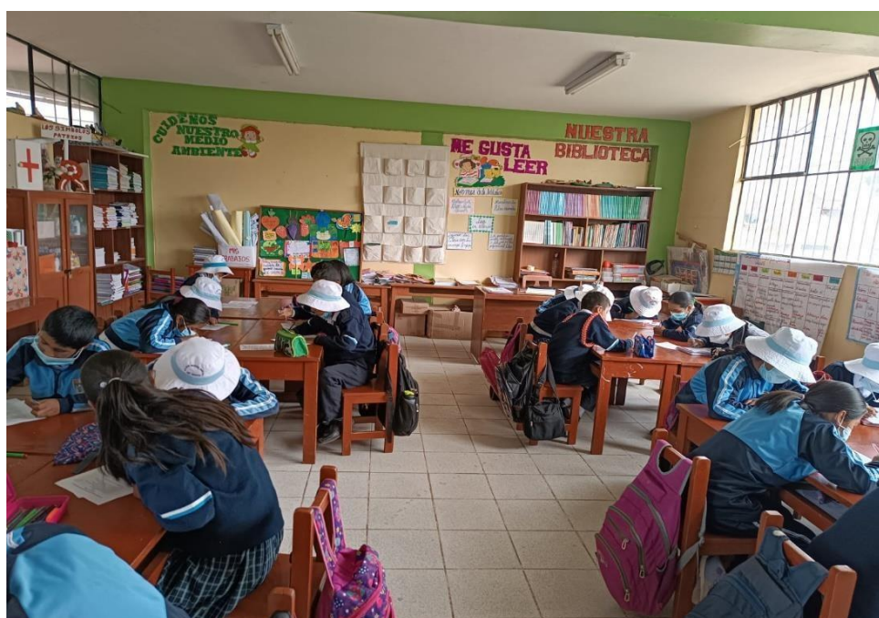
PARTICIPAANTES DE LA ZONA RURAL