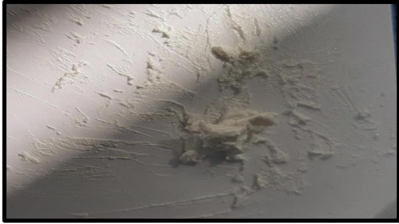
Preparación de la pasta de Hoshino