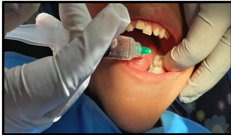
Irrigación y limpieza de la pieza 75