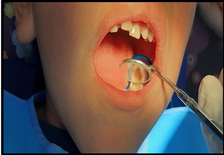
Eliminación completa de tejido careado.