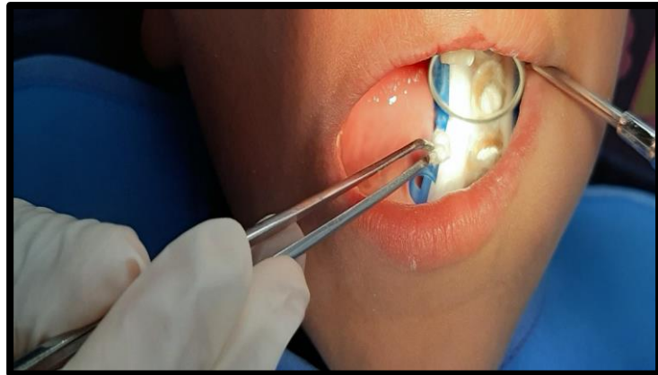
Obturación pieza 75 con pasta de Hoshino