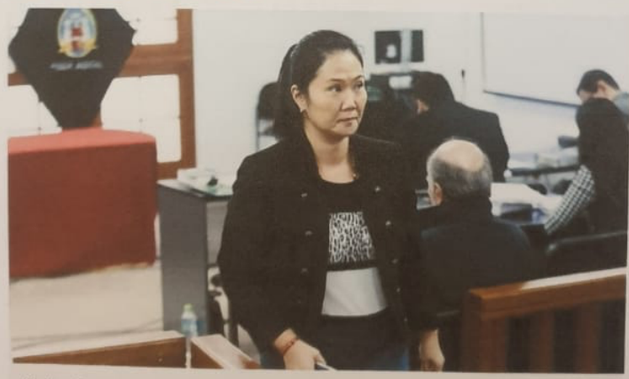
Keiko Fujimori: entre los reveses judiciales y la espera por el TC