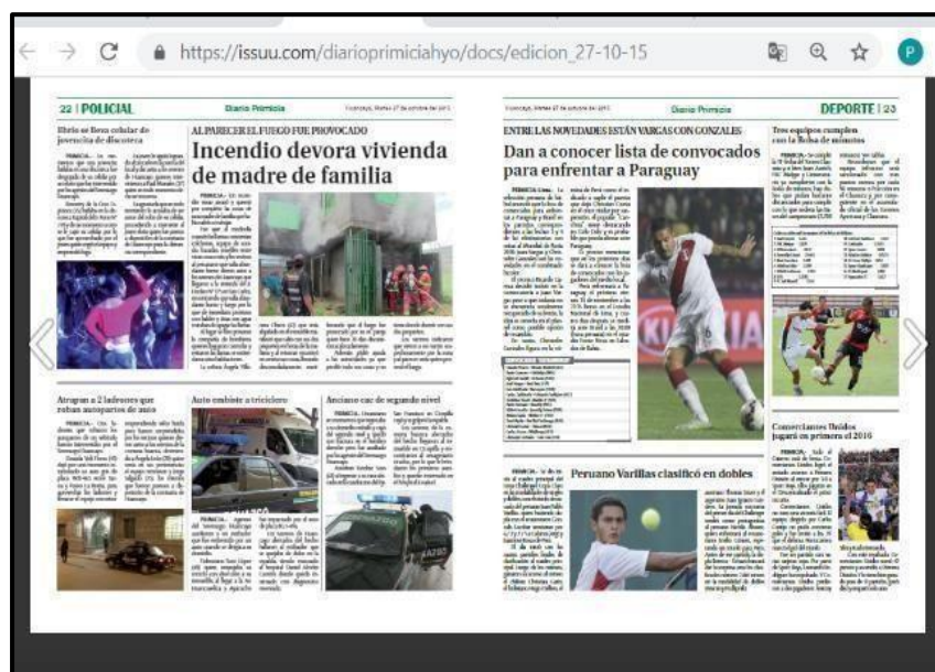
Figura 2. Noticia sobre sereno agresor

Como se puede corroborar de esta noticia, esta es la evidencia, de que el personal que conforma el cuerpo de Inspectores de Tránsito en la comuna huanca, no está realizando sus funciones a cabalidad, en razón a la falta de idoneidad para contratar, la falta de criterio en el proceso de selección, trae como consecuencia este tipo de actos que atentan contra la seguridad pública, aspecto totalmente diferente al que en realidad persiguen, contribuyendo de esta manera con el desorden dentro de la ciudad, además que se genera un ambiente de discordia entre los sujetos que resguardan el orden y los resguardados, por lo que resulta viable cambiar los requisitos para formar parte de los Inspectores de Tránsito dentro de la municipalidad de Huancayo.