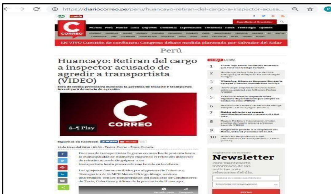
Figura 1. Noticia sobre inspector agresor

Los problemas relacionados con el mal trato de estos agentes que reguardan el orden público generado que muchas veces, su comportamiento se rechazado por la población, quien se ve indignación frente a tales hechos, esta situación es producto de la falta de criterio para contratar a estos efectivos así tenemos algunas noticias con implicancia de lo señalado: