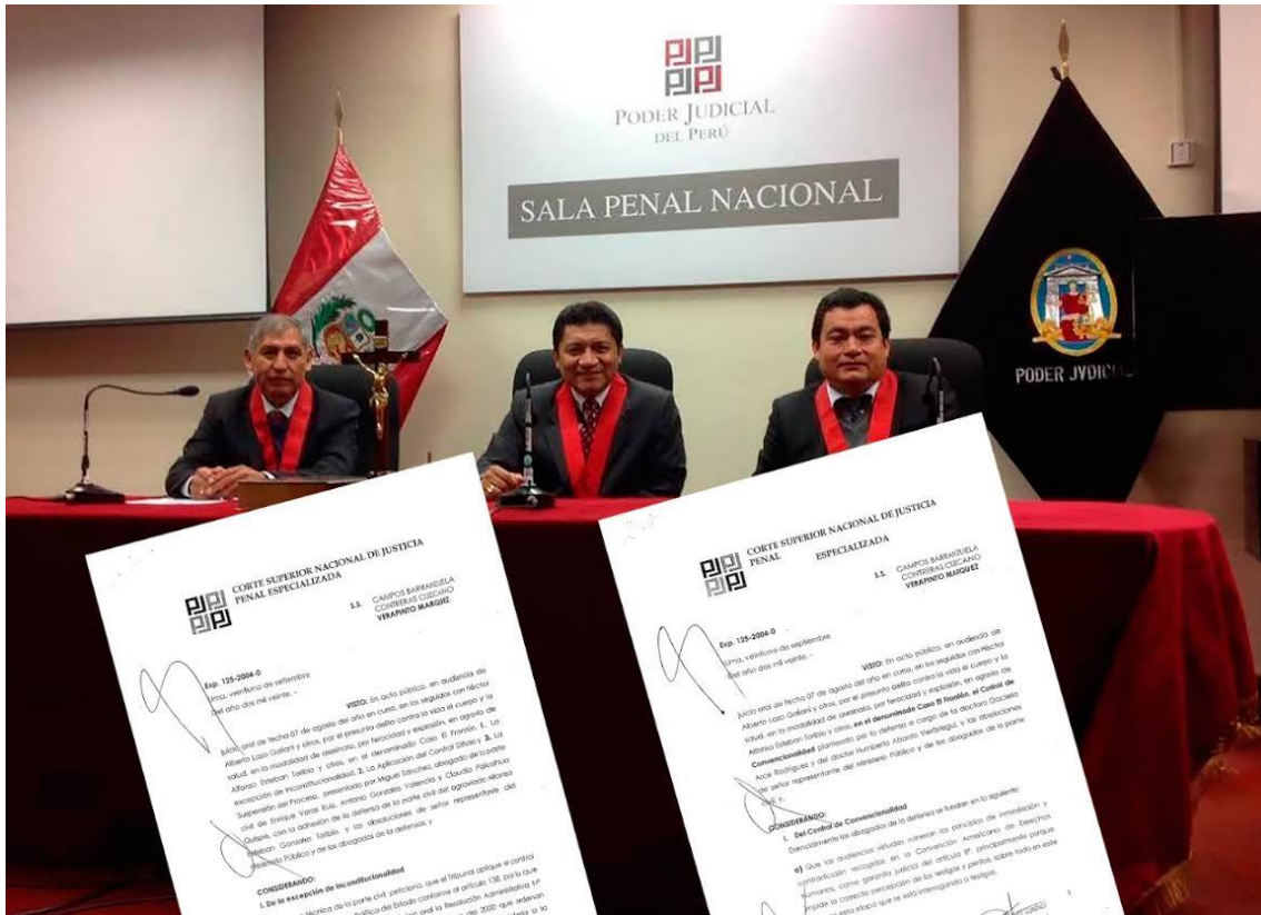
Figura No 03 Protocolo de video de audiencia