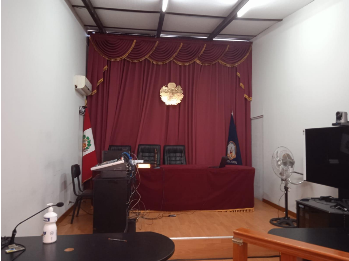
SALA DE AUDIENCIA DEL DISTRITO JUDICIAL DE SELVA CENTRAL SEDE SATIPO