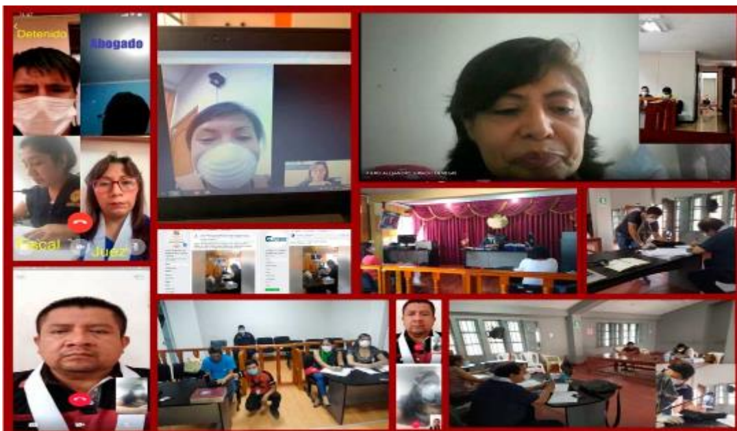
Figura No 01 Audiencias virtuales en el Perú