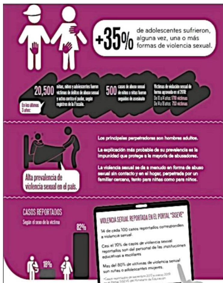
Tabla N° 2. VIOLENCIA SEXUAL

Como describe la imagen el 35% de adolescentes sufrieron alguna vez, una o más formas de violencia sexual. Dentro de los últimos tres años la cantidad de 20,500 niñas, niños y adolescente fueron víctima de delitos de abuso sexual y actos contra el pudor.