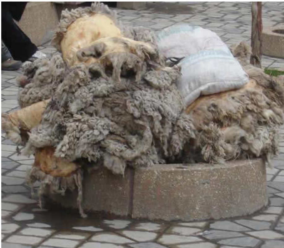
Piel de ovino

La industria manufacturera de Junín se halla localizada en un 75% en Huancayo, que en 1996 tenía registradas 309 empresas.