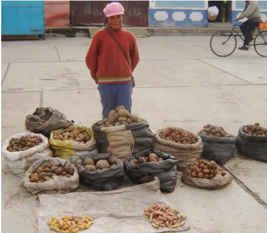
Variedades de papa en Junín