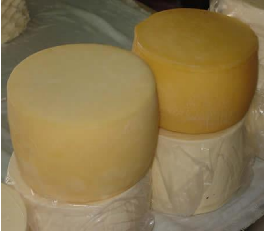
Variedades de queso de Junín