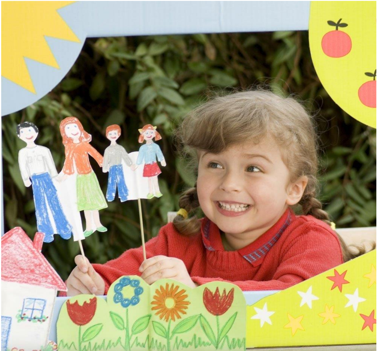
Dramatización con títeres.