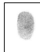
Autor: Rios Nateros, Judith Teresa DNI N°: 73227038