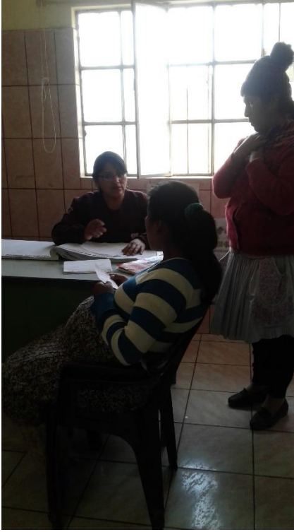
Paciente llegando al área de obstetricia en trabajo de parto.