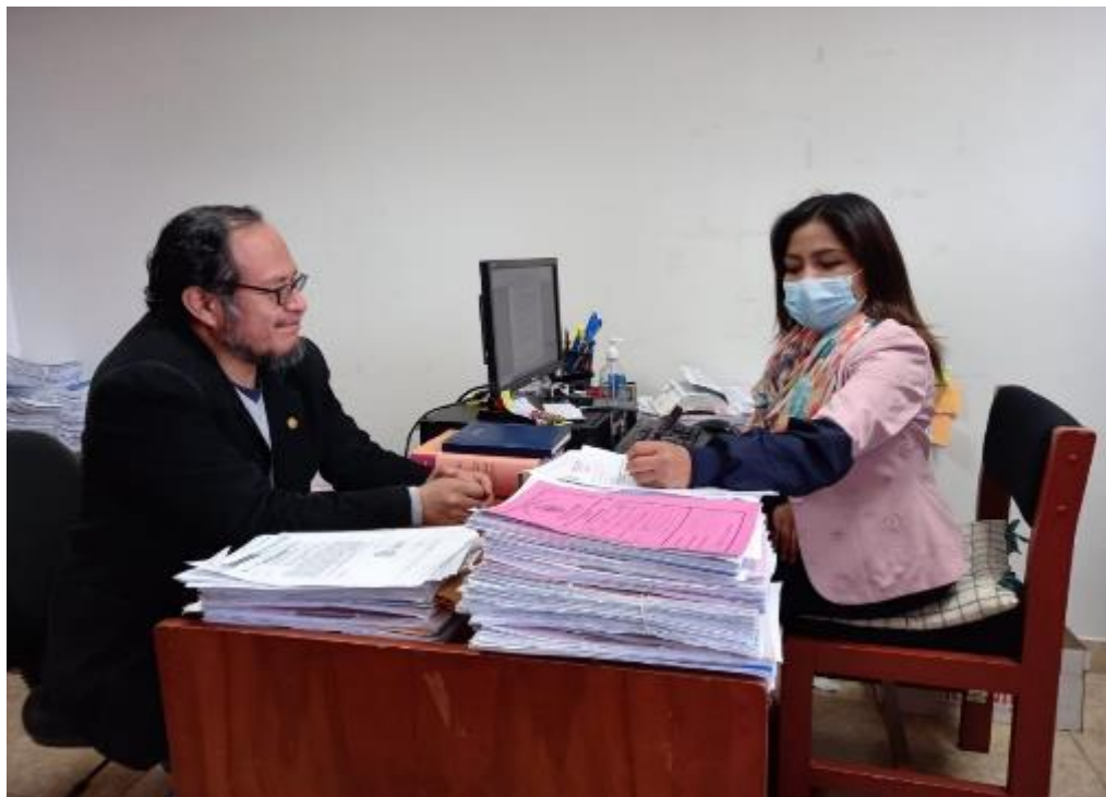
Tesista brinda indicaciones a la Fiscal Adjunta Provincial de la Cuarta Fiscalía Provincial Penal Corporativa de Huancayo, Rosario Arteaga Torres para el desarrollo del instrumento.