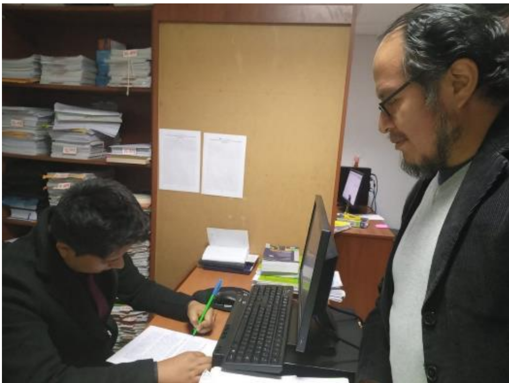
Fiscal Adjunto Provincial Diego Rodas Espinoza de la Tercera Fiscalía Provincial Penal Corporativa de Huancayo.