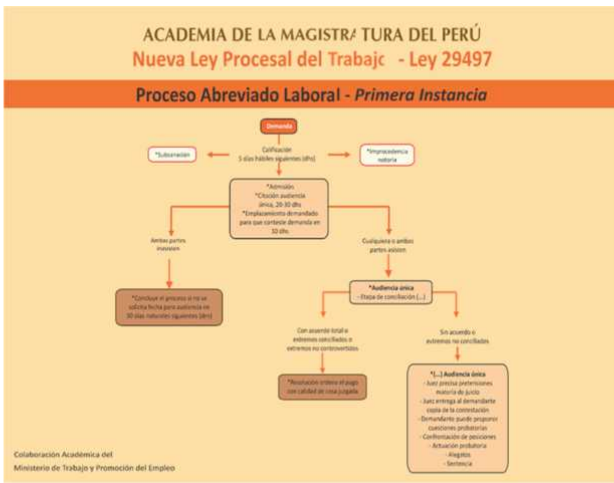
Figura 1 Proceso Abreviado

Si de las cuestiones probatorias se considera que es necesario se actué un informe pericial con el que no se cuenta en la audiencia, el Juez puede excepcionalmente, fijar fecha para la continuación de audiencia dentro de los treinta (30) días hábiles siguientes.