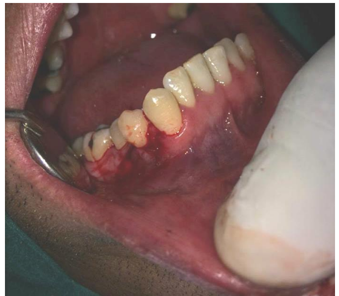
FIG. 8 y 9 Realizamos la separación del colgajo