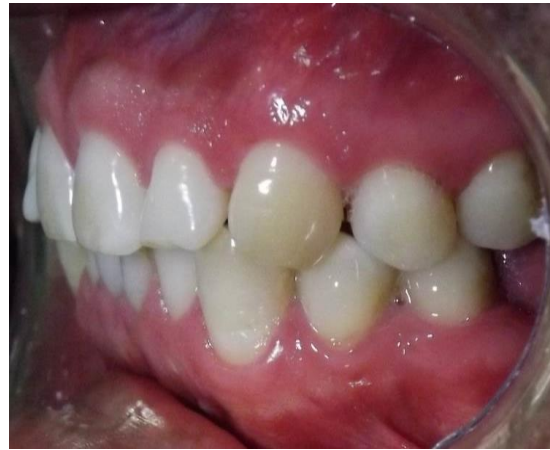
FIG. 6 Lateral izquierda