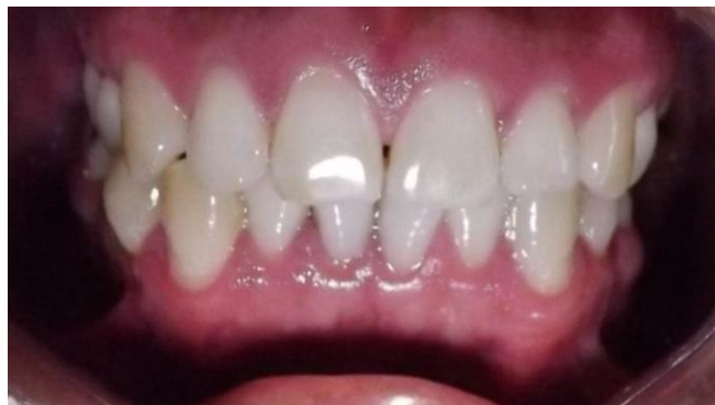
FIG. 7 Frontal anterior