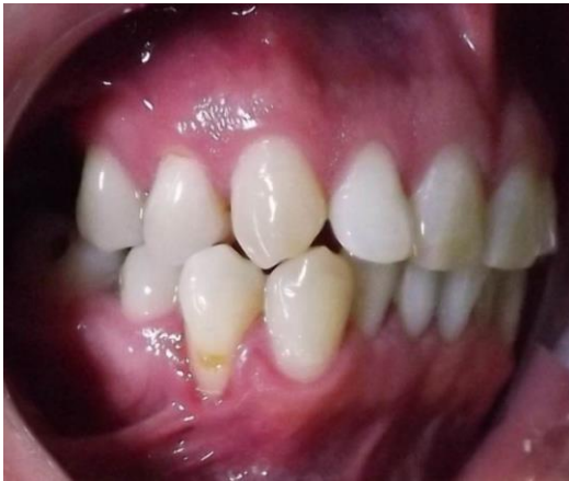
FIG. 5 Lateral derecha, pza. 4,4 recesión gingival