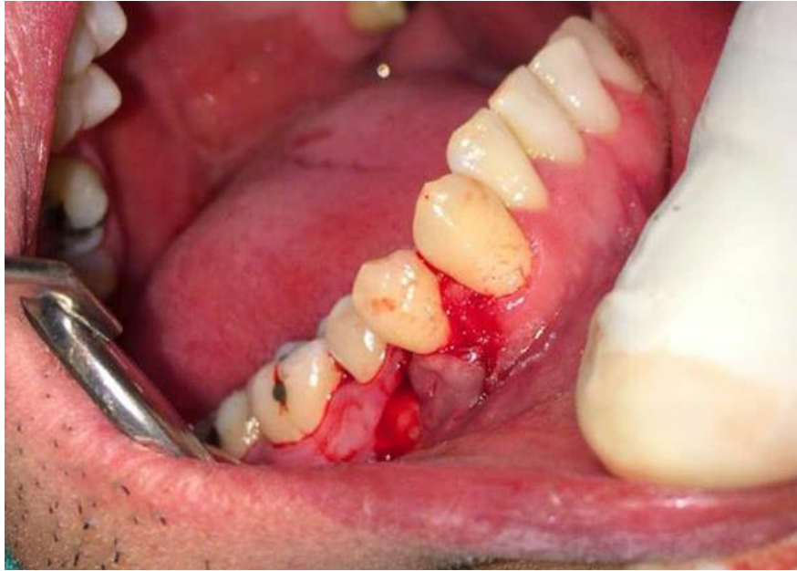
FIG. 10 Conformación y reposición del colgajo