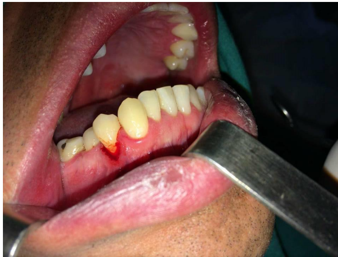
FIG. 8 Realizamos la incisión intrasulcular