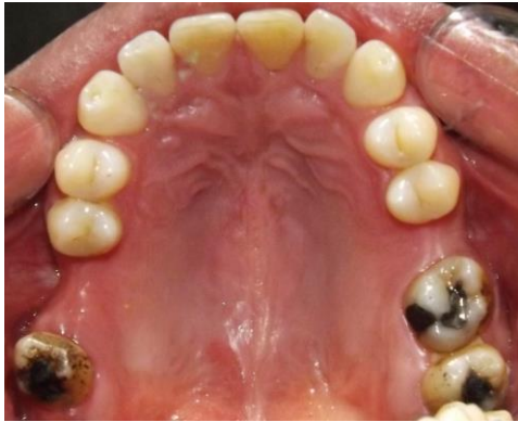
FIG. 3 Oclusal superior