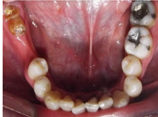
FIG. 4 Oclusal Inferior