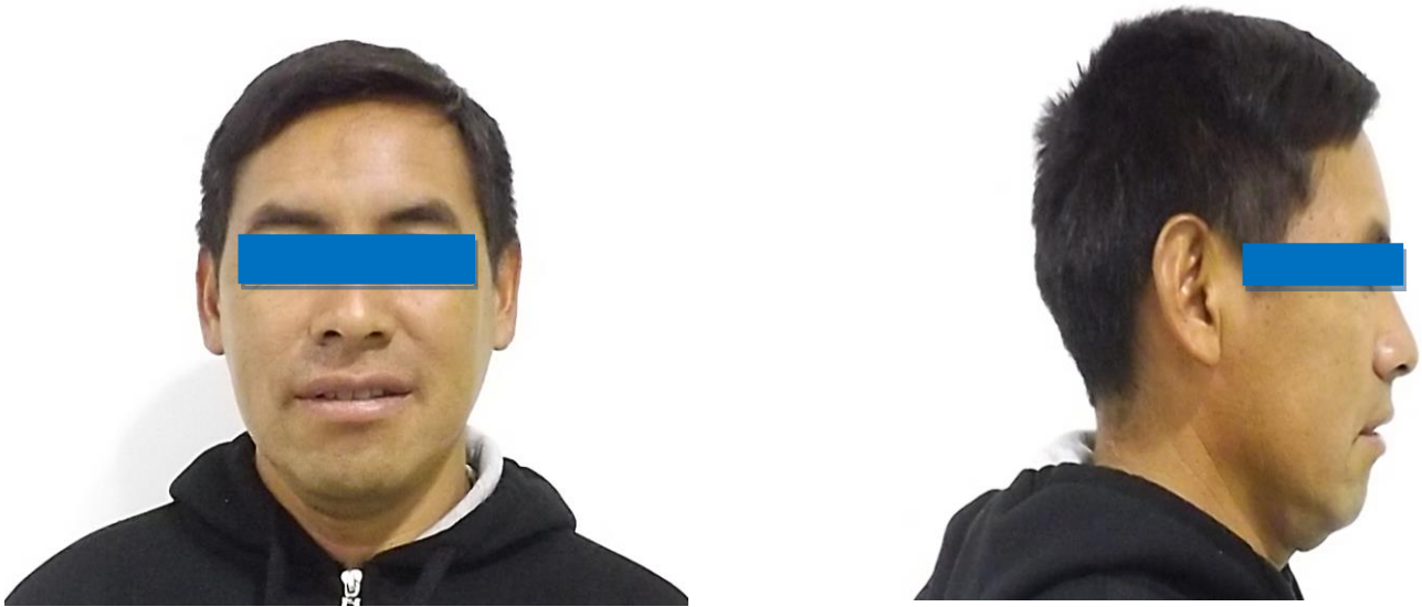
FIG 1 y 2: Fotografías frontal y perfil del paciente