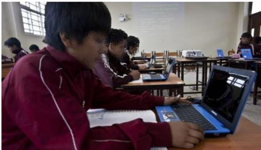
Figura 1. Las nuevas tecnologías mejoran el acceso a la educación y forman parte inherente en las nuevas generaciones

Organizaciones internacionales aseguran que las tecnologías no deben verse como una amenaza sino como una posibilidad