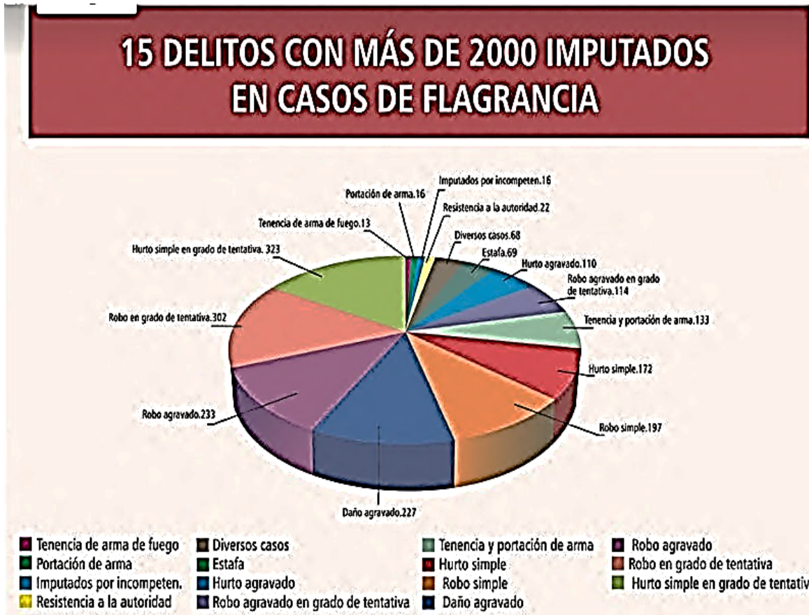
Tabla N° 03