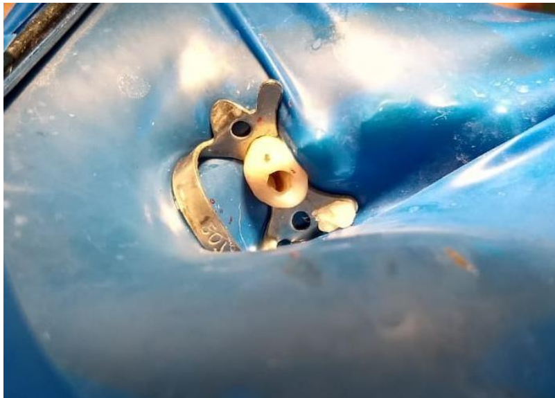
Fig. 3 Acceso cameral por la cara oclusal de pieza 1.4.