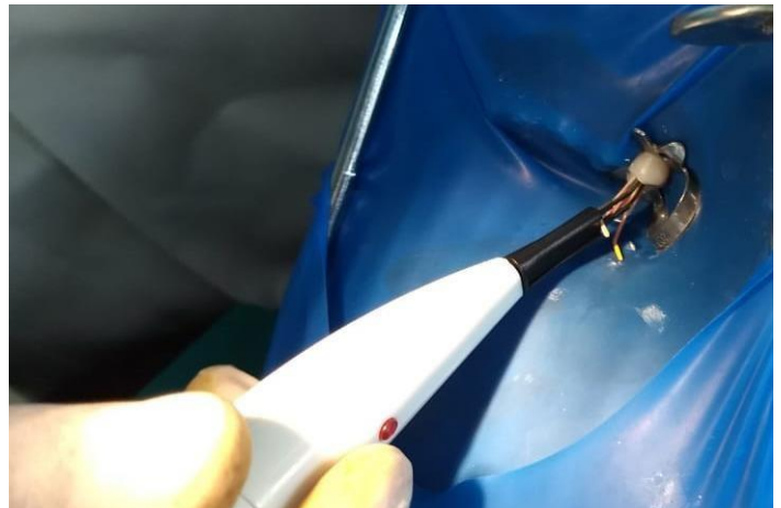
Fig. 8 y 9 Obturación del conducto de pieza 1.4.