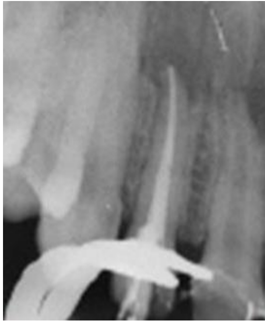
Fig. 10 Obturación del conducto de pieza 1.4.