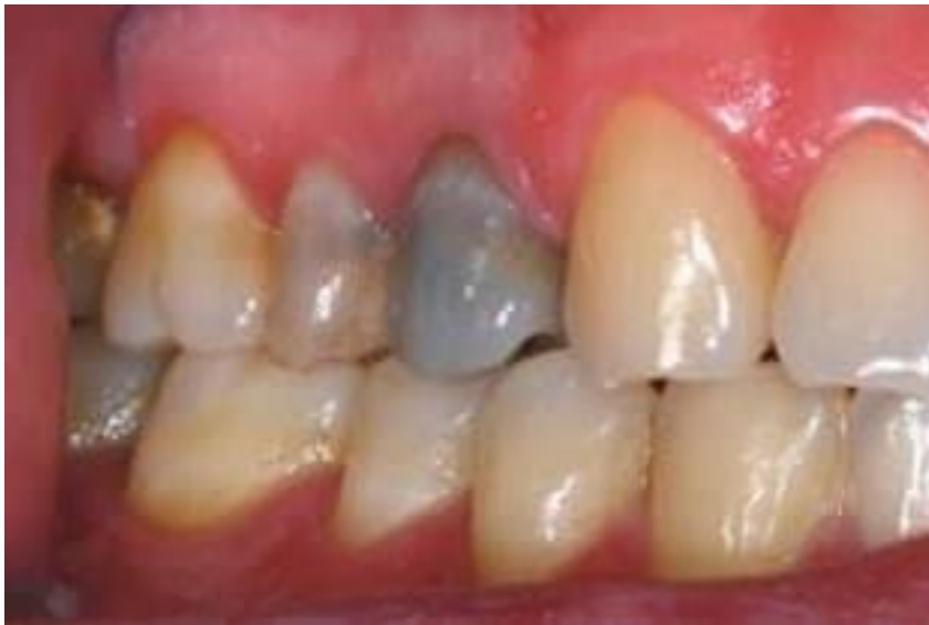
Fig. 1 pieza dental 1.4 con caries profunda y decoloración.