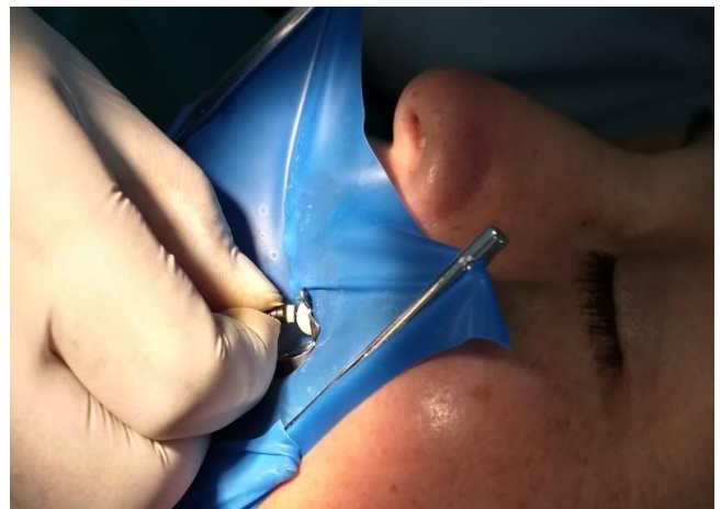
Fig. 5 y 6 Preparación biomecánica de pieza 1.4.