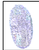
Autor : VILLANUEVA TOLENTINO KATERIN GRECIA Huella DNI N° : 72358851