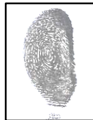
Autor : REYES ROMERO ELIANA DIONISIA Huella DNI N° : 46403869