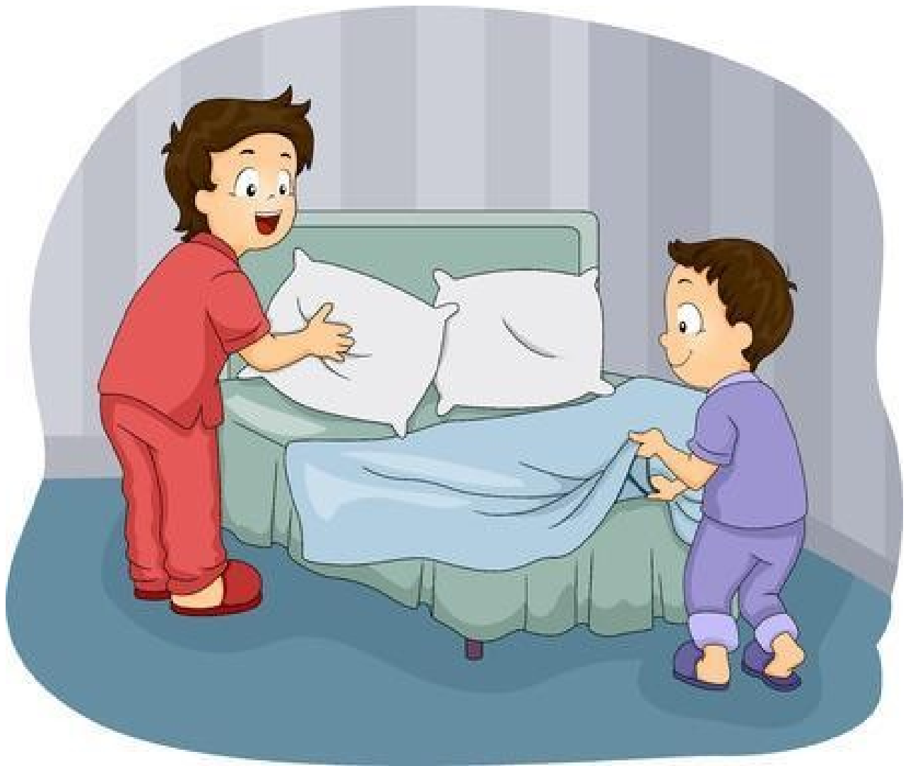
LOS HIJOS TENDIENDO LA CAMA