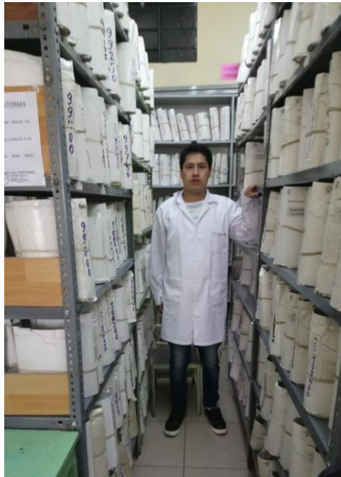
Servicio de estadística del Centro de Salud La Libertad