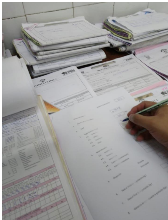
Transcribiendo los datos de la historia clínica a mi instrumento de evaluación