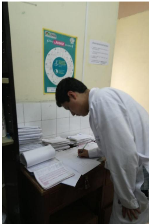
Utilizando el instrumento de recolección de datos de una historia clínica