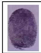
Autor : Quispe Ponce Jassmin DNI N°: 77566202