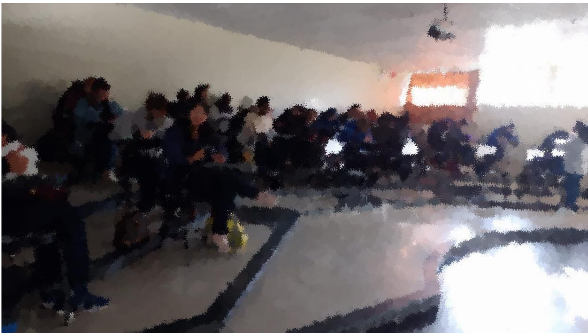
(Explicación de la resolución del cuestionario)