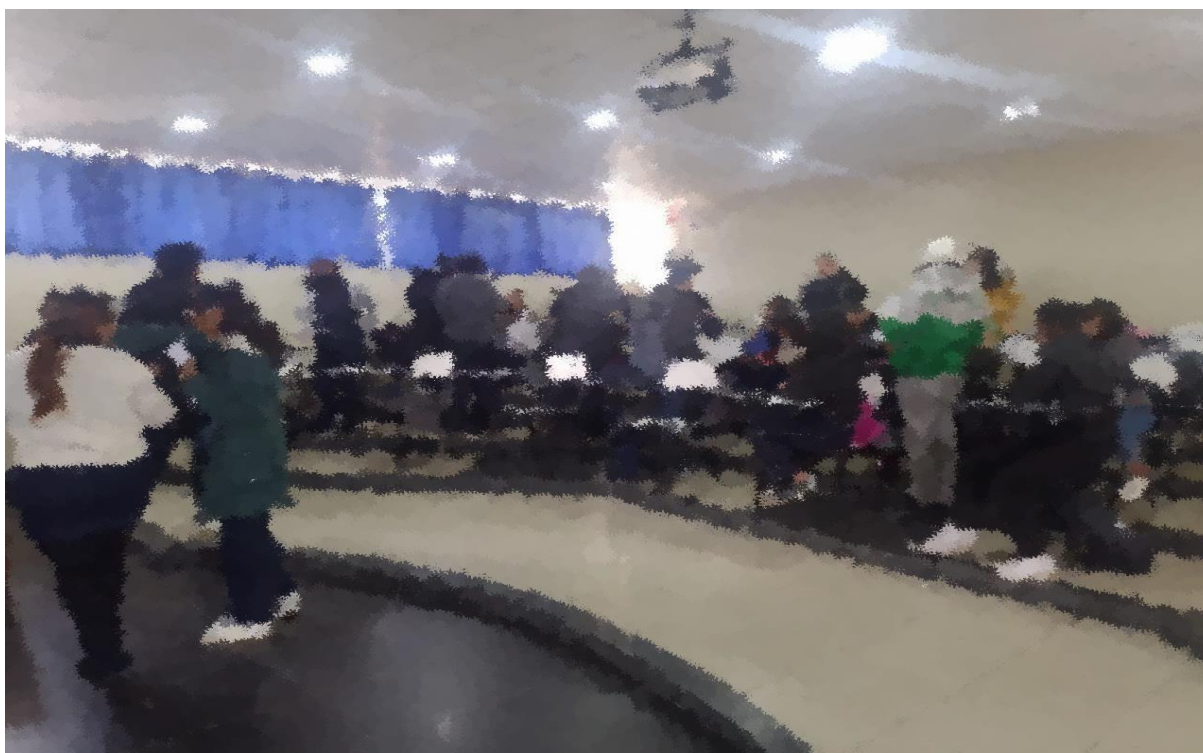
(Término del cuestionario)