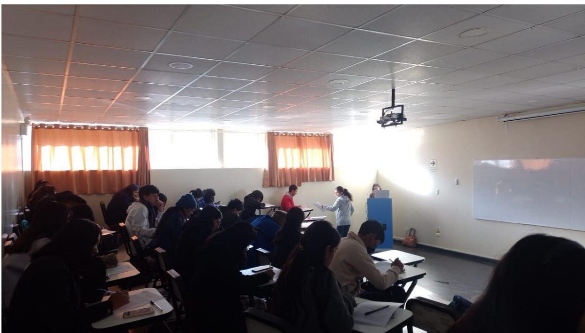
(Aplicación del cuestionario)