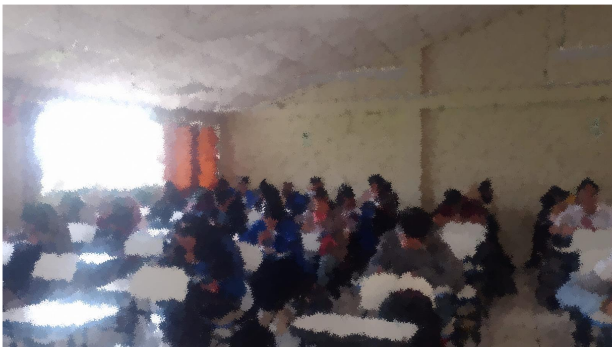
(aplicación del cuestionario)