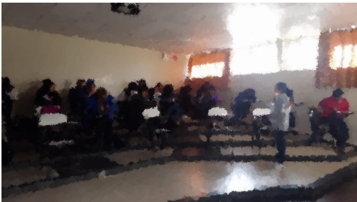
(Explicación de la resolución del cuestionario)