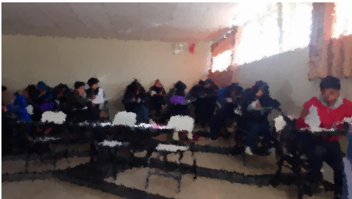
(Aplicación del cuestionario)