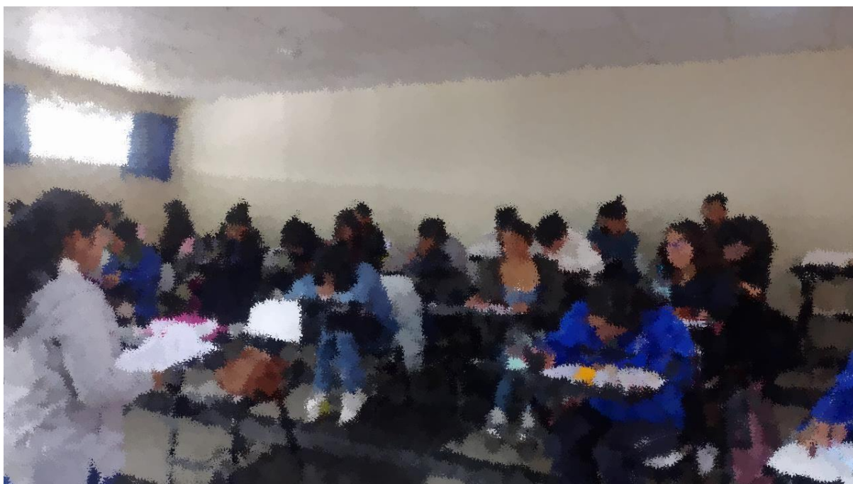
(Explicación de la resolución del cuestionario)