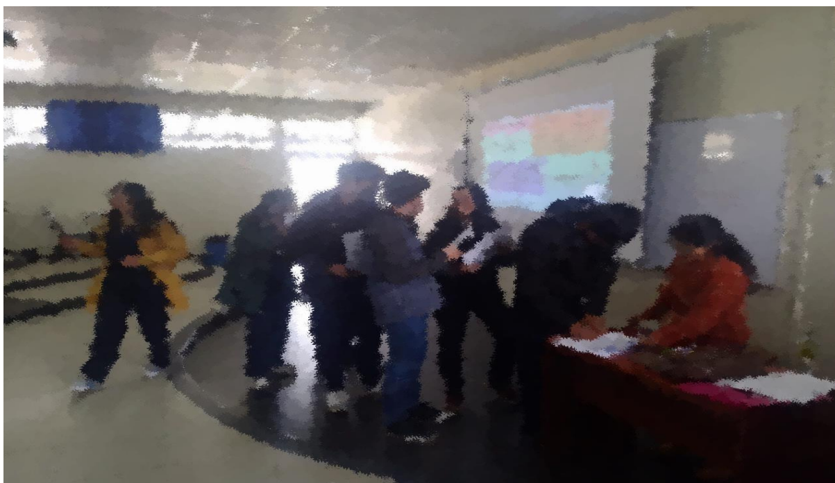
(Término del cuestionario)