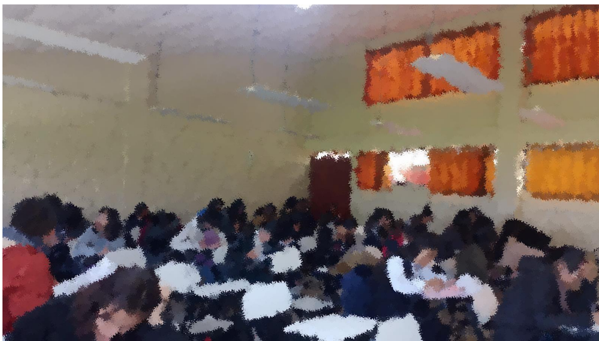
(aplicación del cuestionario)