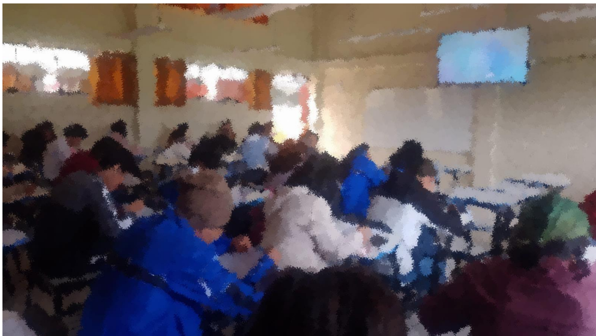
(aplicación del cuestionario)