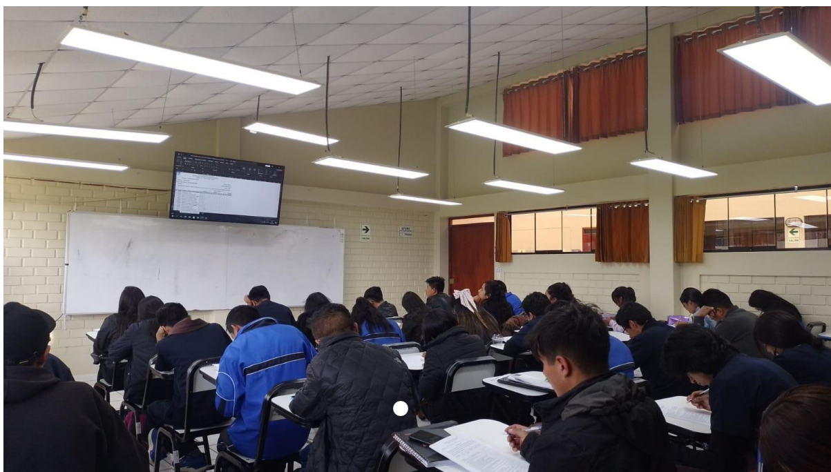
(aplicación del cuestionario)