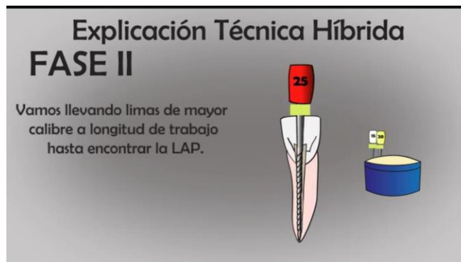
TABLA N°9 FASE 2 LIMA #25