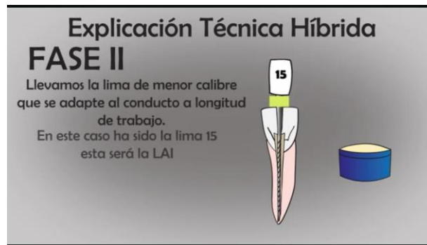
TABLA N°7 FASE 2 LIMA #15