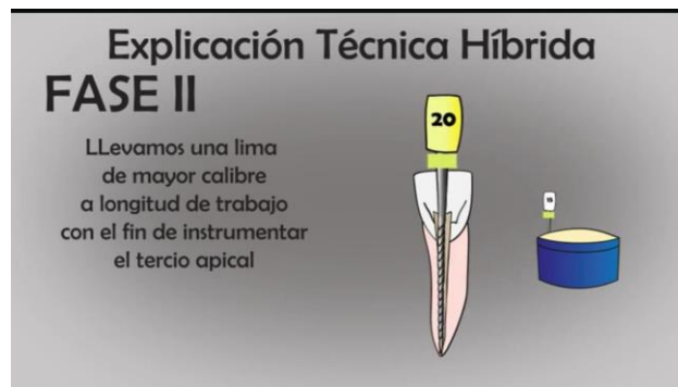
TABLA N°8 FASE 2 LIMA #20