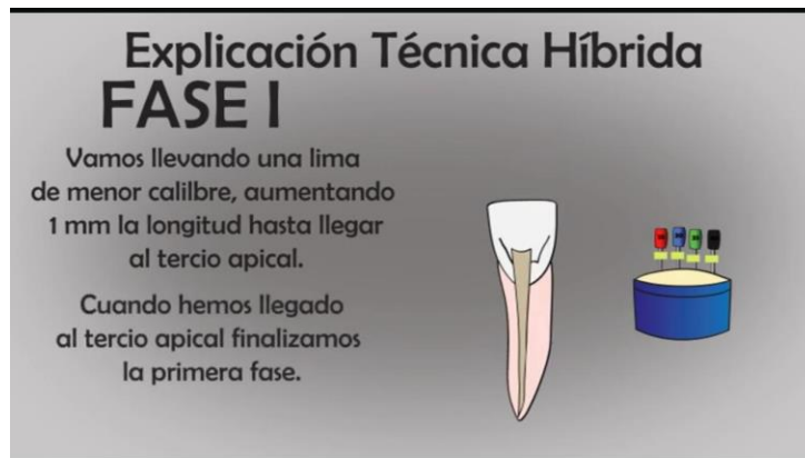
TABLA N°6 FASE 1 FINAL