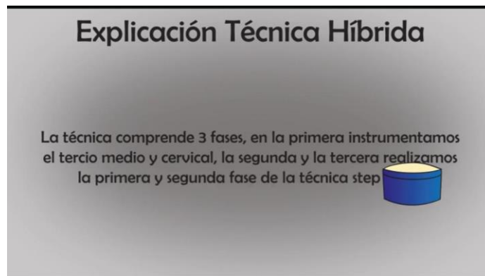
TABLA N°1 CONCEPTO

Cuando llegemos al tercio apical hemos concluido con la primera fase de esta técnica