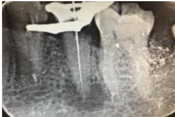
FIGURA 8 CONDUCTOMETRIA DE LA PIEZA 3.5 SE OBSERVA AUN LA PRESENCIA DE MATERIAL COMPATIBLE CON ABSCESO