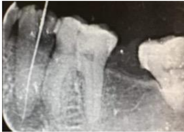
FIGURA 7 LIMA NUMERO #15 APLICADA EN LA FASE 2 DE LA TECNICA HIBRIDA