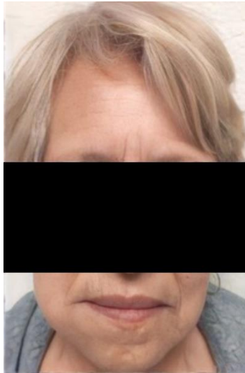
FIGURA 5 PACIENTE EN FASE 1 DE LA TECNICA HIBRIDA