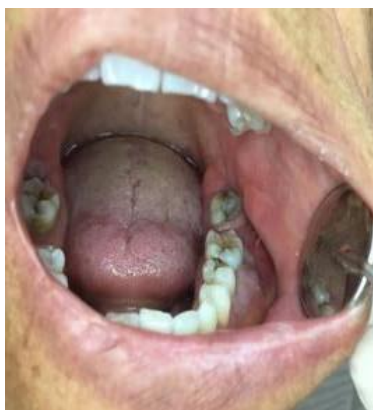
FIGURA 4 EXAMEN INTRAORAL SE VE INFLAMACION PROGRESIVA

Paciente llega con un absceso alveolar Agudo en el lado derecho inferior