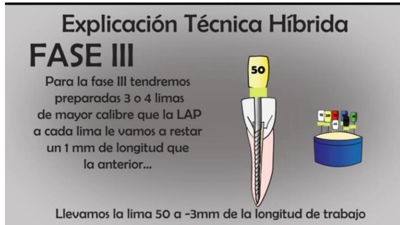
TABLA N°15 FASE 3 LIMA #50