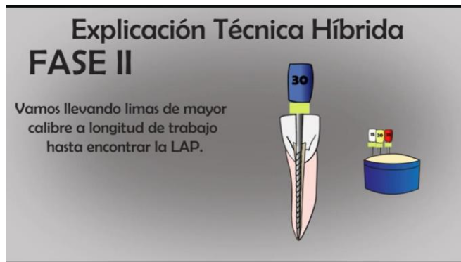
TABLA N°10 FASE 2 LIMA #30