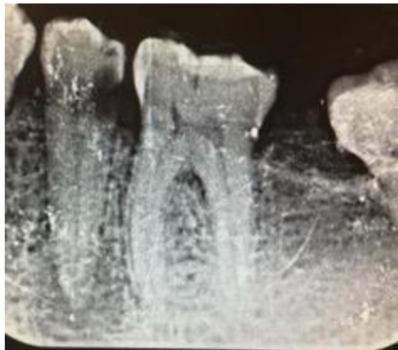
FIGURA 6 IMAGEN RADIOLUCIDA COMPATIBLE CON MATERIAL TRANSLUCIDO SE OBSERVA UN ABSCESO ALVEOLAR AGUDO