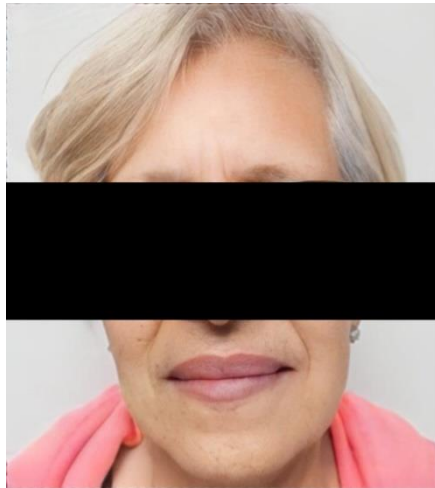
FIGURA 12 PACIENTE TOTALMENTE REHABILITADA

PIEZA OBTURADA LISTA PARA SER DERIVADA A A UNA CLINICA PRIVADA