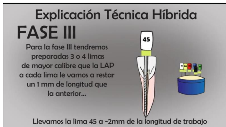
TABLA N°14 FASE 3 LIMA #45