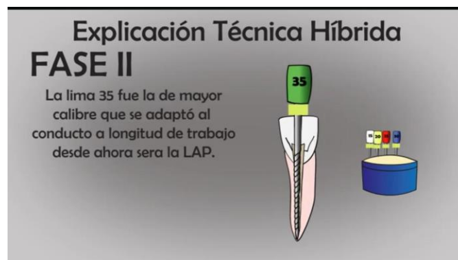
TABLA N°11 FASE 2 LIMA #35