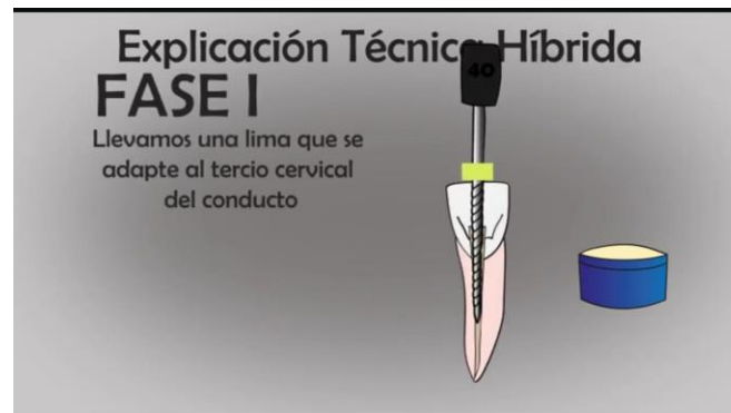
TABLA N°2 FASE 1 LIMA #40