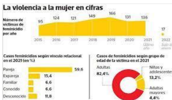
Figura 2: Cuadro de Violencia a la mujer

Entonces nos preguntamos, la Ley dictada por el Estado a fin de prevenir, erradicar y sancionar el maltrato hacia mujer es eficaz, ya que no se ven resultados de dicha norma, más aún, teniendo en cuenta que en la misma se prevén medidas de protección a fin de proteger a las víctimas de agresiones y no culminen en ser una víctima de femicidio más en el diario regional.