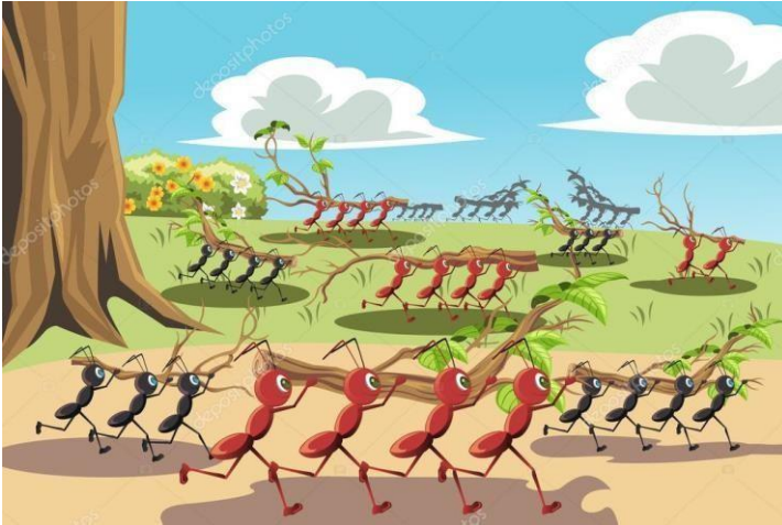
Hormigas discutiendo por una migaja de pan